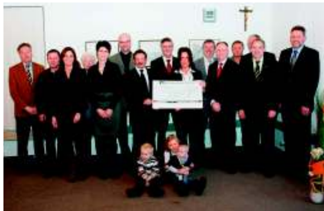
Unser Bild zeigt die Spendenempfänger mit den Jubilaren bei der Übergabe im Gebäude der Bank.

Gelegenheit, den Bankmitarbeitern ihre Einrichtungen und Aufgaben näher zu erläutern, und erwarben damit viel Verständnis und Anteilnahme für ihre Arbeit.