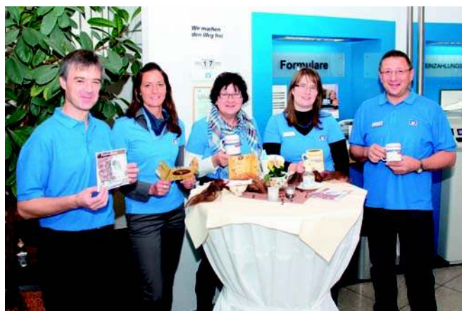
Prämienkaffee in Bleialf

Die Mitarbeiter der Raiffeisenbank Westeifel eG freuten sich über das allseitige Interesse der Kunden. Viele Prämien konnten noch für dieses Jahr gesichert werden. Informieren Sie sich jetzt online über Ihre Chancen auf www.rb-westeifel.de .